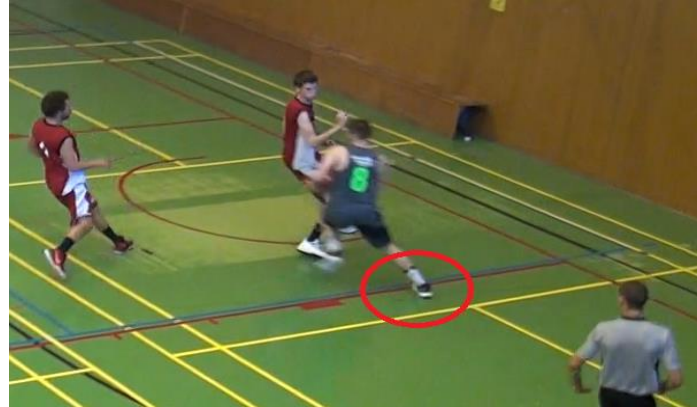
Il fait un second appui à nouveau sur son pied droit : PAS 1 même pied - KO Mouvement non autorisé, un marcher aurait dû être sifflé