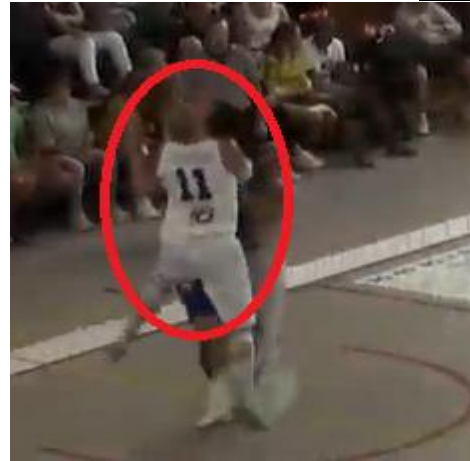
C'est un "attentat"... A sanctionner absolument en faute antisportive!!!