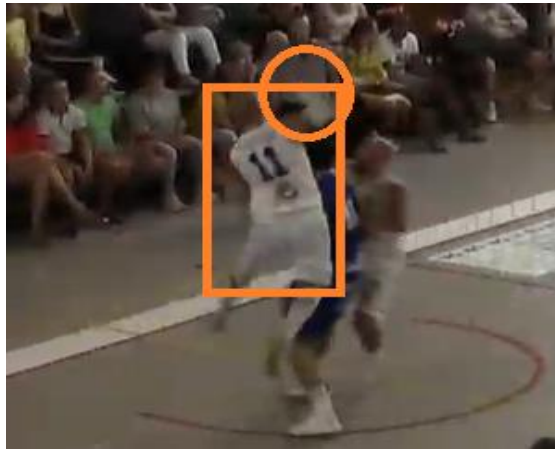
On comprend directement que le 11 blanc veut faire la faute !!!