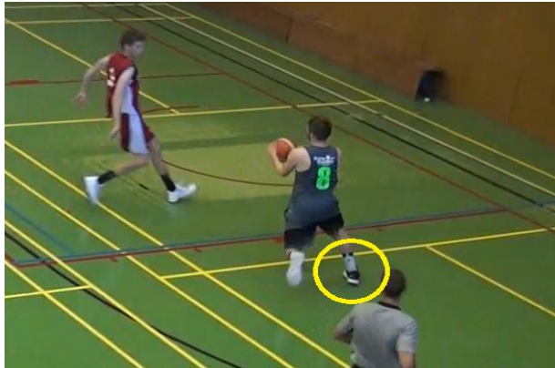
L'attaquant reçoit une passe et est sur son pied droit : PAS 0 - OK